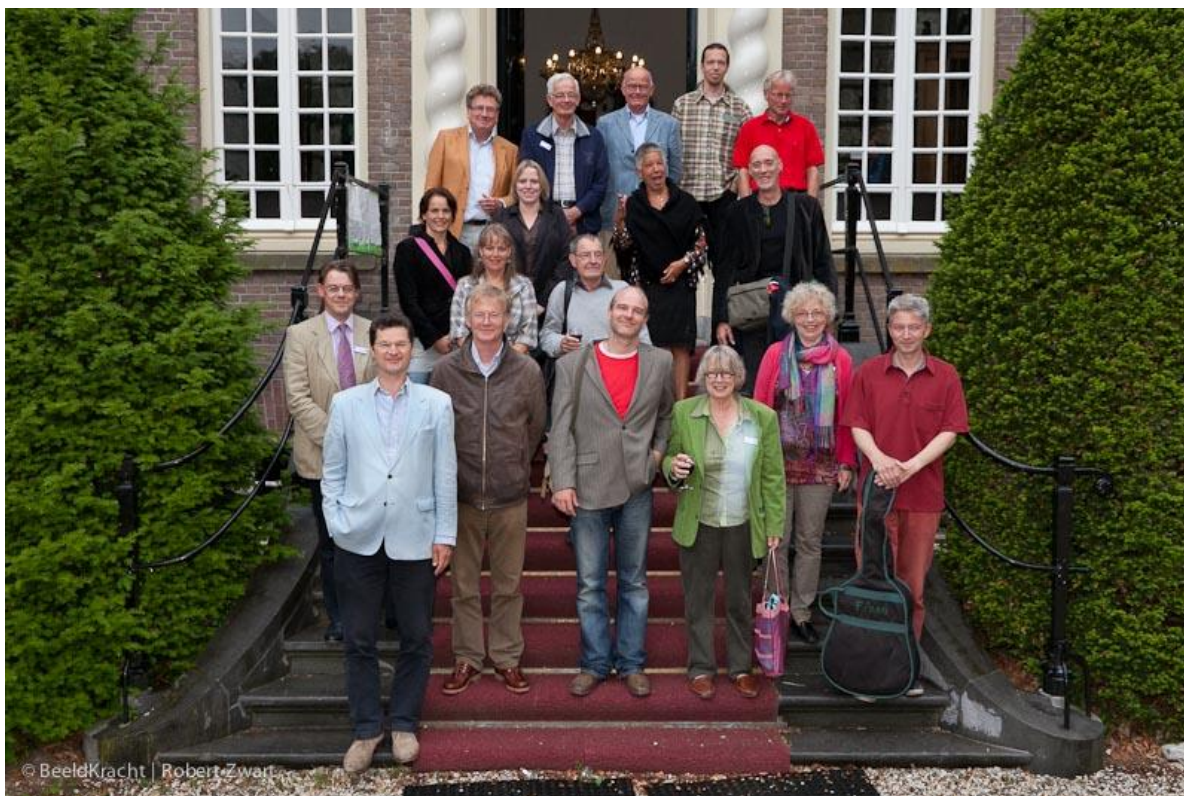
Bordesfoto met een deel van de aanwezige schrijvers