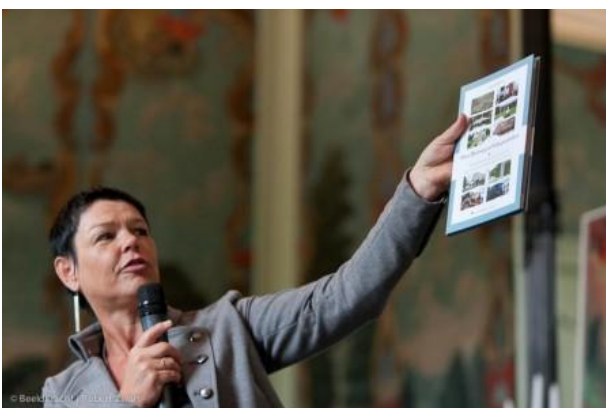
Eén van de boeken uitgegeven bij uitgeverij kleine geschiedenis van de Heuvelrug