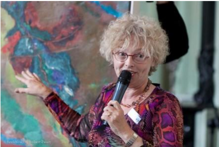
Hetty Wouda maakte de schilderijen en foto's voor het boek Godinnen van de Heuvelrug