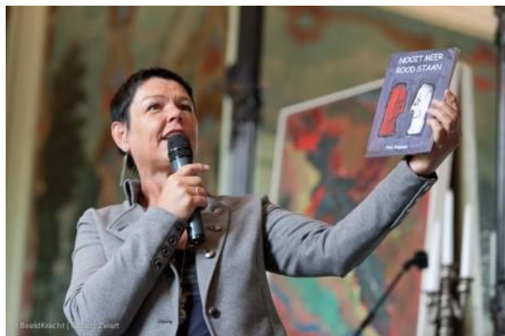
De wens van alle aanwezigen – Nooit meer rood staan, geschreven door Paul Rispens (Leersum)