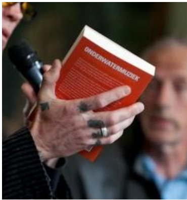
Onderwatermuziek van Roeland Schweitzer (Amerongen, poëzie en roman)